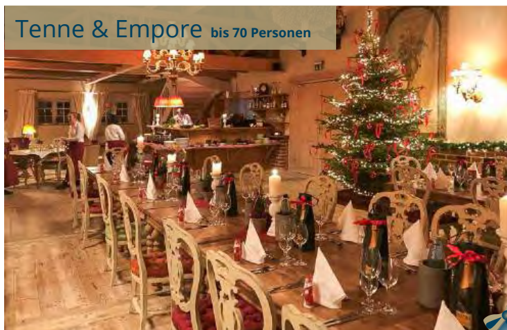
Tenne & Empore bis 70 Personen